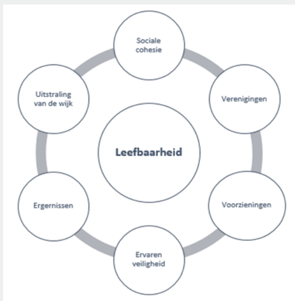
Figuur 2. Factoren die invloed hebben op leefbaarheid in Sanderbout

“Leefbaarheid is vooral veel plezier met elkaar te kunnen hebben, door met elkaar te kunnen praten. Geen geruzie in de wijk. Met elkaar met respect kunnen communiceren. Iets kunnen organiseren. Dat is een praatje maken op straat en genieten van andere mensen en de kinderen van anderen en samen genieten van de dagelijkse dingen.”