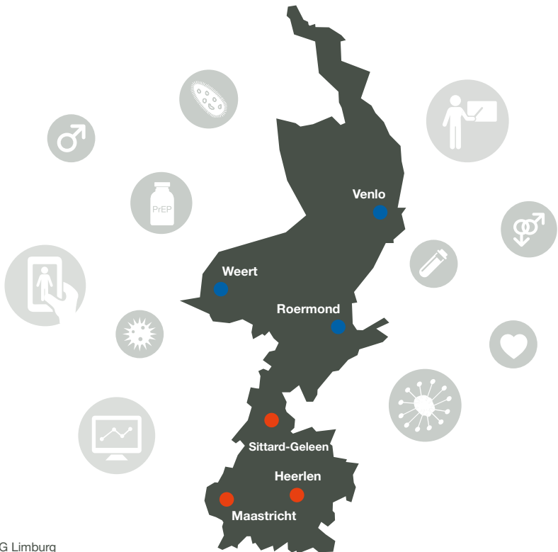
Locaties CSG Limburg

Mannen die seks hebben met mannen, ook wel MSM genoemd, behoren tot een risicogroep. Deze folder voor huisartsen richt zich specifiek op deze belangrijke doelgroep.